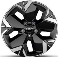
17-Zoll-Leichtmetallfelgen, nur für EV