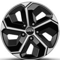
16-Zoll-Leichtmetallfelgen, serienmäßig bei Hybrid und Plug-in Hybrid