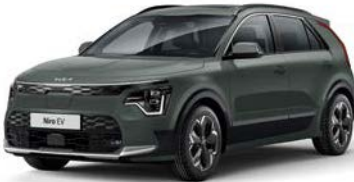
Cityscape Grün Metallic (CGE)