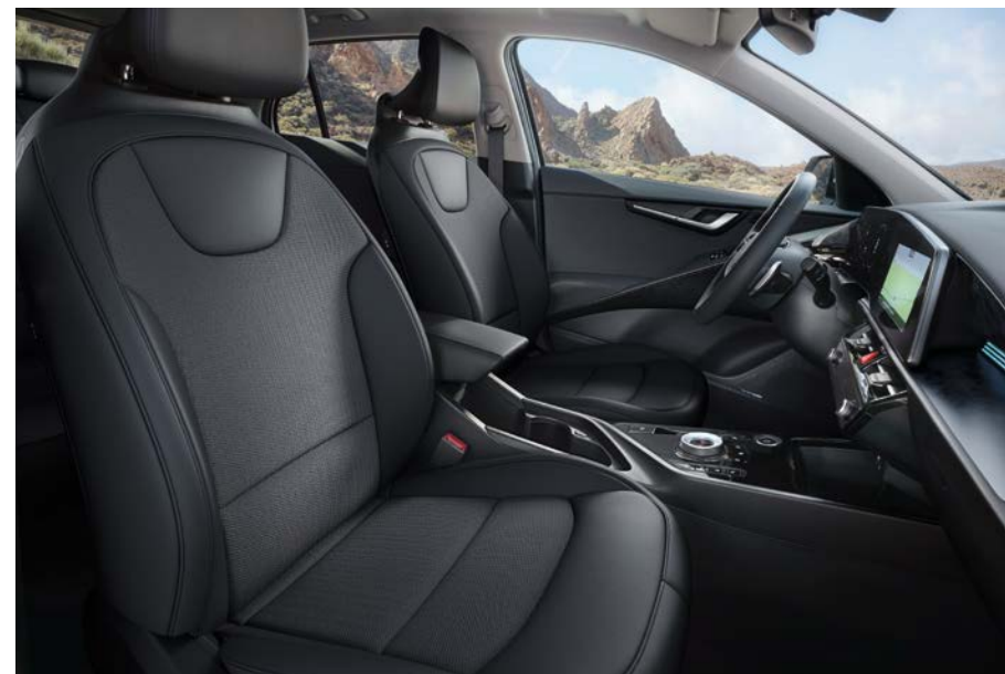
Sitzbezüge in Stoff-Leder-Kombination (mit hochwertiger Ledernachbildung), Charcoal-Grau (DFS) (optional für Vision).