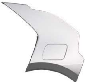
Stahlgrau Metallic (KLG), nur für EV