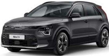
Interstellar Grau Metallic (AGT)