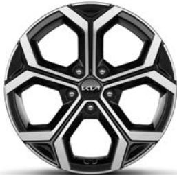
18-Zoll-Leichtmetallfelgen, nur für Spirit (Hybrid und Plug-in Hybrid)