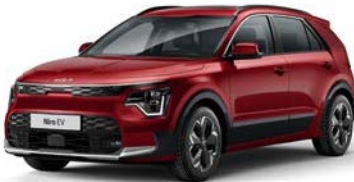
Runway Rot Metallic (CR5)