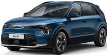
Mineralblau Metallic (M4B)