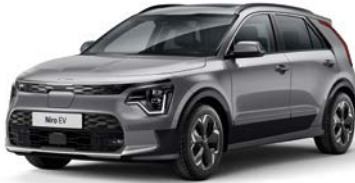
Stahlgrau Metallic (KLG)